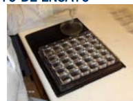
2º.- Preparación de diluciones y siembra